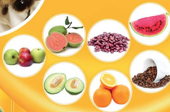
flor de laranjeira

US$ 235-577 bilhões/ano (Potts et al. 2016) US$ 12 bilhões/ano (Giannini et al. 2015)